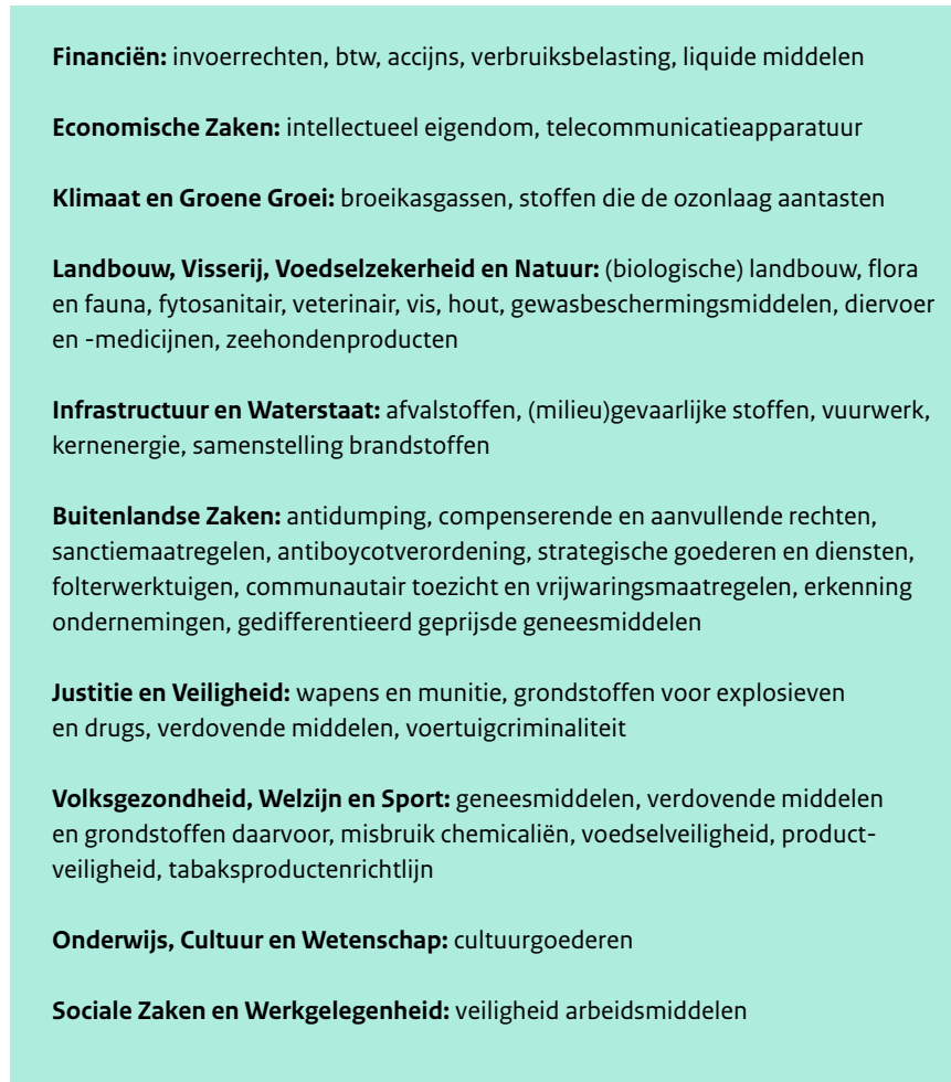
Figuur 1: Opdrachtgevende ministeries